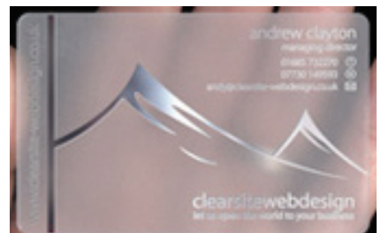
Danh thiếp bằng nhựa trong