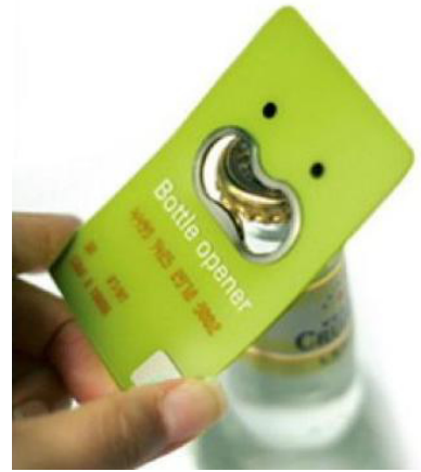
Danh thiếp kèm cái mở chai