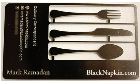
Danh thiếp bằng kim loại

Dù với bất kỳ chất liệu gì, kiểu dáng ra sao, dù đẹp hay không, danh thiếp cần có đủ thông tin cần thiết bao gồm tên, chức vụ, tên công ty, địa chỉ, số điện thoại (số cố định hoặc di động), địa chỉ email và website của công ty để đối tác luôn có thể liên lạc với chủ nhân của tấm danh thiếp khi cần thiết. □