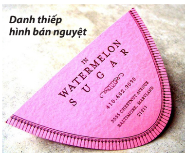
Danh thiếp hình bán nguyệt