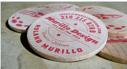
Danh thiếp hình tròn