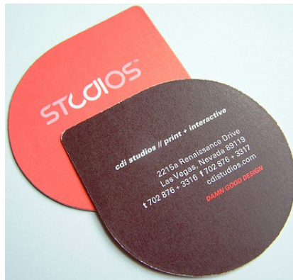
Danh thiếp hình giọt nước

như kim loại hoặc gỗ; có thể làm bằng sôcôla hay nhựa trong... Có hình dáng, nếp gấp, hình chạm nổi hoặc rìa thiệp không như bình thường, hoặc ghép thành hộp vuông. Những loại này sẽ đắt hơn các loại danh thiếp bình thường. Chủ nhân của tấm danh thiếp sẽ trở nên rất đặc biệt so với người khác.