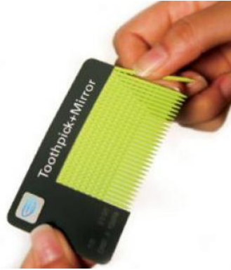
Danh thiếp kèm lược và tấm

4. Loại có chất liệu hay hình dạng khác biệt : danh thiếp sử dụng các chất liệu